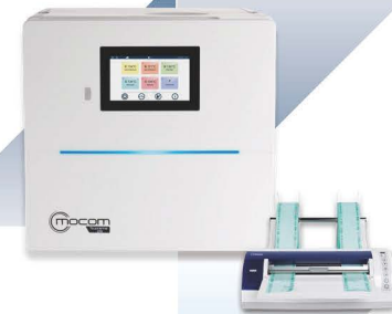
MILLSEAL PLUS REF WCMY00A0000