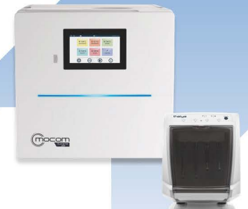
THALYA REF 7G100000